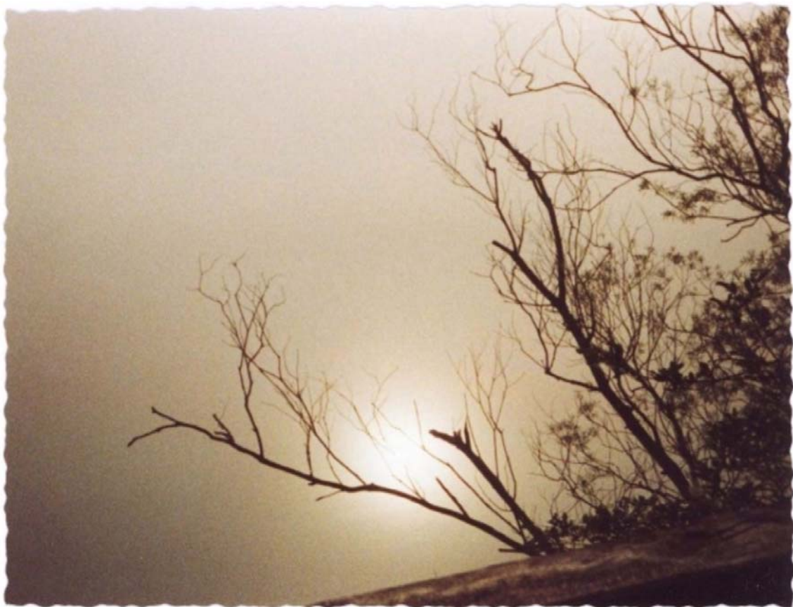
Morgenstimmung am See im Spätherbst