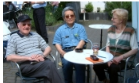
DF2CW mit ON4QN und seiner XYL