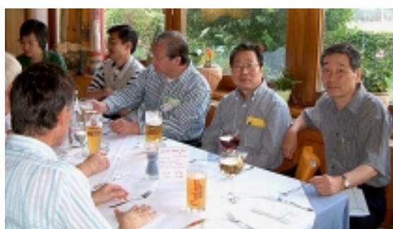
Abend im Yacht-Club-Restaurant