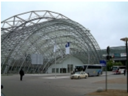
Neue Messe Leipzig

Da zur Zeit die meisten Hallen alle leer waren bzw. umgebaut wurden fuer kuenftige Veranstaltungen, wirkten sie besonders gross. Mit ein bisschen Fantasie kam man sich vor wie in einem Science-Fiction-Film, auf einer Marskolonie oder den Biosphaeren einer riesigen Raumstation. Welch' ein Unterschied zur Alten Messe!