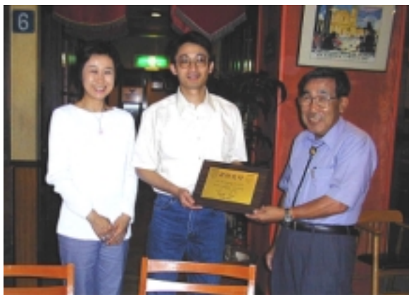
J10SBR, JR0DLU und JA3PE