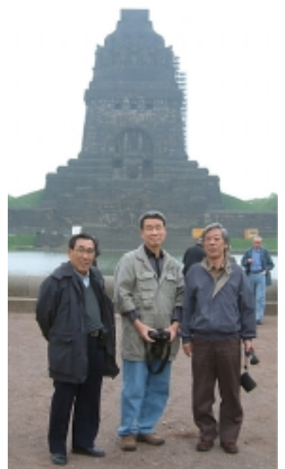
v.li.n.re: JA3PE, JJ1EEJ, JA1MYW