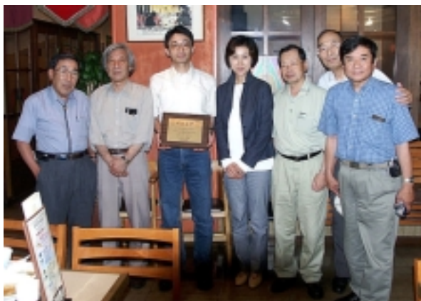
v. li. n. re: JA3PE, JA1MYW, JR0DLU, J10SBR, JA1DKN, JA1FY, JG1AFE