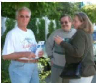
DJ80T, DJ6DO und DE1MCH