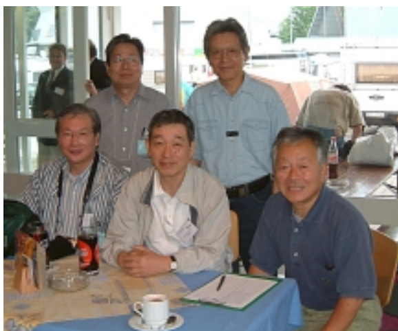
v.li.n.re sitzend:JA1FUY, JA1AYC, JG1GWL v.li.n.re stehend:JA1CVF, DF2CW

Die naechste HAM-Radio 2003 findet in der Neuen Messehalle (Naehe Flughafen) statt.